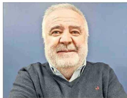
JULIO SALAS SUBSECRETARIO DE PESCA Y ACUICULTURA

“La inquietud obviamente persiste, pero uno se va (del seminario) con una mayor esperanza en el sentido de que están dispuestos en el Gobierno a conversar”.