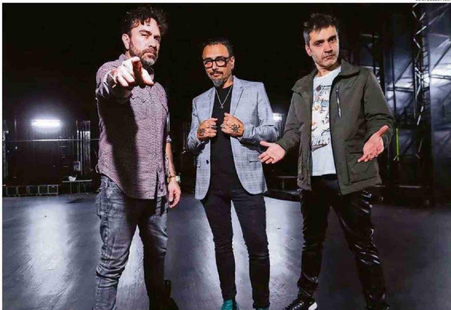
EL GRUPO PROMETE TEMAS INÉDITOS Y REVERSIONES DE SUS CLÁSICOS PARA LAS PRESENTACIONES VENIDERAS.

"Creo que el concepto de Sesión 3000 tiene que ver más con la música nueva de Lucybell, que es