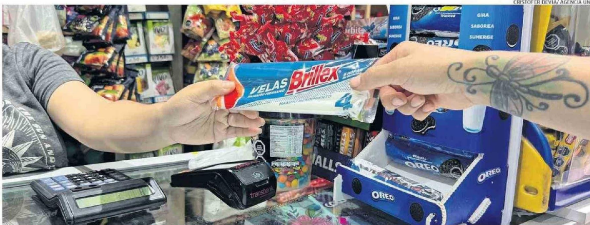
EL CORTE DE LUZ AFECTÓ A 14 REGIONES DEL PAÍS. EN LA REGIÓN FUERON MÁS DE 160 MIL CLIENTES QUE SE VIERON PERJUDICADOS POR EL CORTE DE SUMINISTRO.

“La gente la verdad hizo caso y lograron de manera tranquila retirarse a sus domicilios. Tuvimos más de 4.180 salvoconductos”, dijo el general. Además, acotó que “tuvimos a través de los más de 600 controles de aire vehiculares, cuatro detenidos. De esos, uno por desacato, otro por ley de pesca y dos por órdenes vigentes. Solamente hubo uno que cometió la infracción por el toque de queda”.