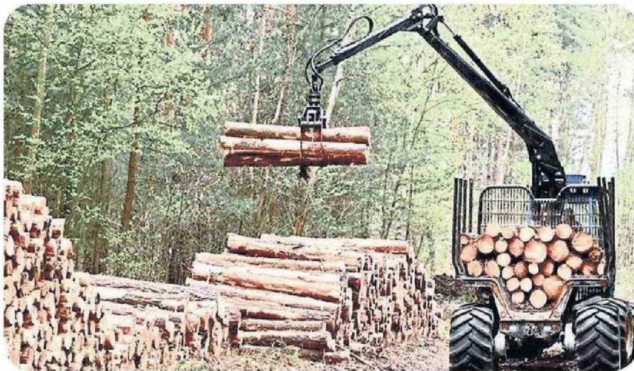
Para Ananías el explorar y fomentar nuevas industrias resulta fundamental en la zona, aquí los tiempos para tramitar inversiones son una de las grandes problemáticas a enfrentar.