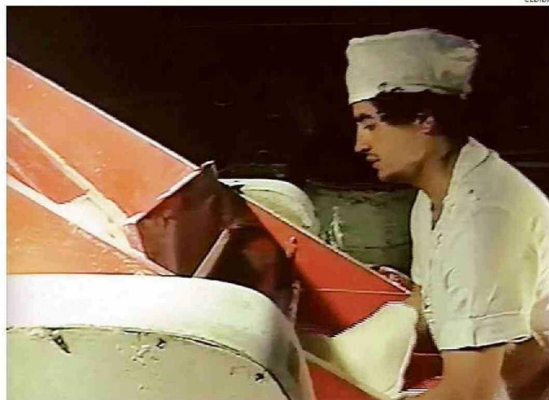
EL VIDEOARTE “EL PAN NUESTRO DE CADA DÍA” REFLEXIONA SOBRE LA MEMORIA DE UN CUERPO AUSENTE A PARTIR DE LA EJECUCIÓN DE JOVEN PANADERO EN DICTADURA.