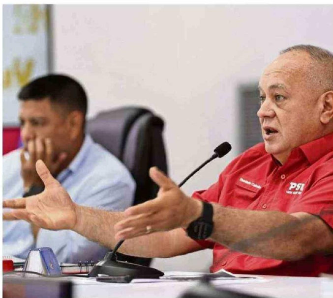
CABELLO SE REFIRIÓ ADEMÁS A LA POSIBILIDAD DE RETOMAR LAS RELACIONES DIPLOMÁTICAS CON CHILE.