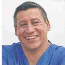
ÁLAMOS ES MÉDICO Y BOMBERO.

Una atribución de tremenda importancia que tiene el gobernador es la de generar políticas públicas regionales, por ejemplo, la Estrategia Regional de Desarrollo, donde se establece la región en modo futuro, con todas sus comunas y localidades, gestionando la respuesta a las necesidades más urgentes, una ruta planificada para el desarrollo futuro de la región, con la sociedad en el centro de cada decisión; salud,