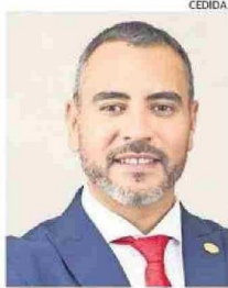
OSSANDÓN ES CORE DESDE 2021.

Como gobernador regional, mi objetivo es liderar una gestión cercana, honesta y orientada a resultados, trabajando en equipo con el Consejo Regional, municipalidades, organizaciones sociales, organismos públicos y privados. Garantizo diálogo, acuerdos y un trabajo transversal. Nuestro enfoque estratégico busca combatir la corrupción, la delincuencia y el crimen organizado, promover el empleo local, dotar de tecnología la fron-