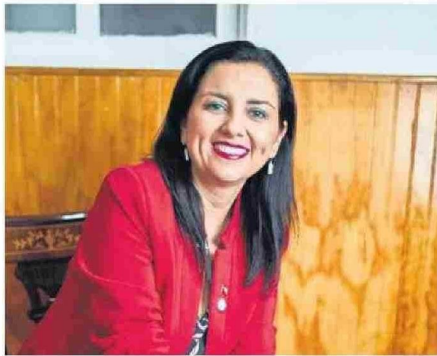
CAROLINA MOSCOSO ACTUALMENTE ES CONSEJERA REGIONAL.