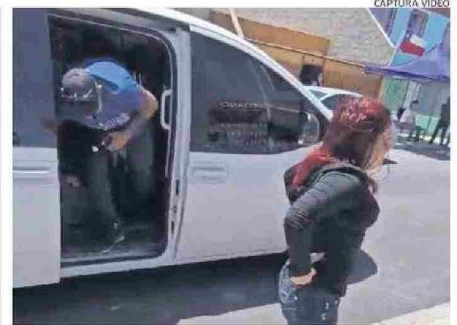
INCLUSO NOMBRARON AL CANDIDATO POR EL QUE IBAN A VOTAR.

Finalmente, para destrabar proyectos propongo lo siguiente: realizar un análisis causal y aplicación de metodología LEAN 6 Sigma para eliminar desperdicios organizacionales. Como segundo punto, es importante generar un mejor acercamiento con los Cores en los proyectos, que se sientan partícipes en el proceso de generación, evaluación y revisión. CS