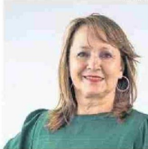
HA SIDO ALCALDESA HASTA MINISTRA.

En 2008 fui candidata independiente a la alcaldía de Antofagasta y resulté electa con el 51,4% de los votos. Desde la municipalidad impulsé más de 20 obras de mejoramiento territorial, entre las que destacan la remodelación del Estadio Regional, la construcción del Estadio Escolar, el Paseo Angamos, el Liceo Científico Humanista de La Chimba, la cancha de Las Almejas, la intervención en sedes vecinales y multicanchas,