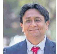
DÍAZ CORRE POR LA REELECCIÓN.

Por eso cuando nos comprometemos para un segundo periodo con el sistema de cámaras de tele vigilancia para to-