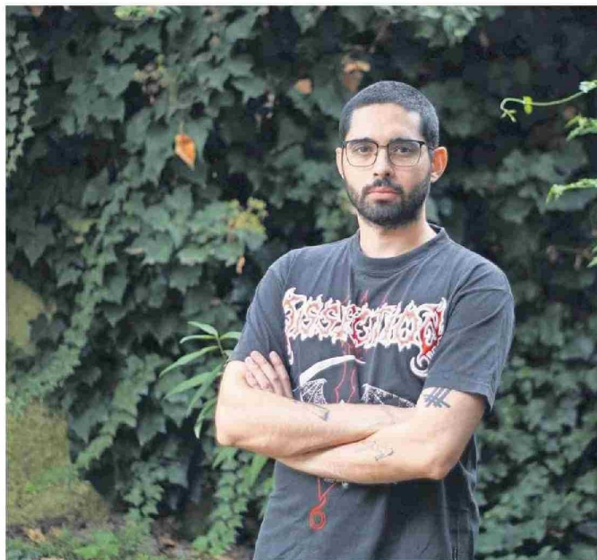
"Me pareció más bien un deber publicar algo para que se hable del tema" de la salud mental, dice el autor.

"La alucinación es más compleja porque te altera la realidad, por ejemplo, en vez de ver un auto ves a un perro y te pueden atropellar por eso, entonces es más complejo porque estaba comprometido mi vínculo con la realidad", agrega el también exbecario de Fundación Neruda, que en "Psicosis lúcida" recuerda a su cuidador, quien falleció al poco tiempo de recibir el alta médica. Al enterarse, escribió Miranda, "esa noche fue una de las más dolorosas. También sentí, no exento de un narcisismo ridículo, que la misión de Pedro había