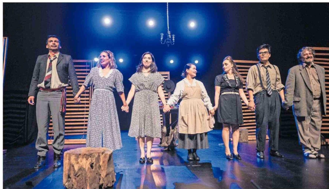
El grupo, que se preparara para estrenar en agosto su nueva obra estará esta tarde en la Sala Principal del Teatro Biobío.

Un tema -el del mal tiempo- que pudo cruzarse con la posibilidad de suspender la versión número 16 del Festival Biobío Teatro Abierto. Algo que tampoco consideraron, pensando en los artistas y el público, y que se reali-