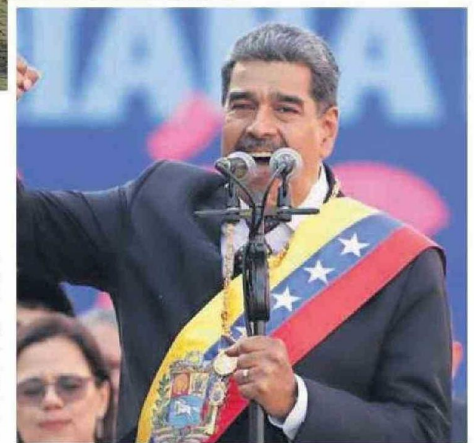
Maduro asumió el viernes su nuevo mandato.

"Mantendremos las relaciones diplomáticas no porque legítimos unas elecciones que no fueron libres desde un comienzo, si no porque "las relaciones diplomáticas son para que los pueblos se unan y no sufran por las desavenencias de sus gobiernos", señaló.