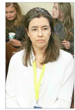
Socióloga concursó a comisión de Mujeres de la Cámara.

El universo creado por J. R. R. Tolkien continúa con su expansión: hoy se estrena la segunda temporada de serie y vienen nuevas películas. | C 12