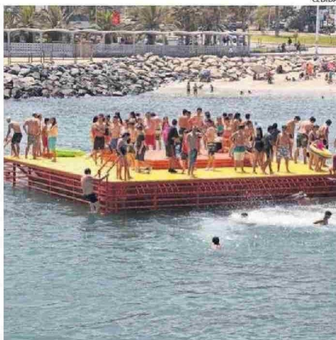
LA BALSE SERÁ INSTALADA ESTE VERANO EN EL BALNEARIO.

cirugías concretó la clínica a pacientes de la región que estaban en lista de espera.