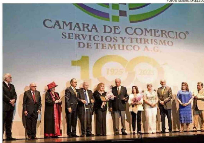
DURANTE LA GALA SE ENTREGARON RECONOCIMIENTOS A DISTINTAS INSTITUCIONES Y SOCIOS DE LA CÁMARA.

cio informal. "Lamentablemente el comercio ambulante y el desorden en el centro de Temuco cada vez se agudiza más. Es un