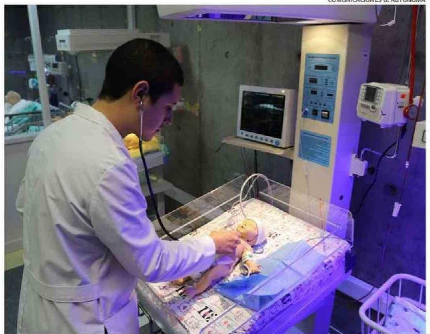
CON ESTA NUEVA CARRERA, SE ESPERA FORMAR MÉDICOS DE EXCELENCIA QUE COMPRENDAN LAS PARTICULARIDADES DEL PANORAMA DE SALUD LOCAL.