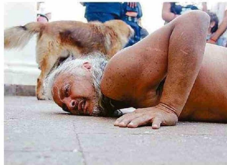
ALGUNOS FIELES ENTRARON ARRASTRÁNDOSE AL TEMPLO.

"Además agradecer la colaboración permanente que ha tenido la Defensa Civil y la Cruz