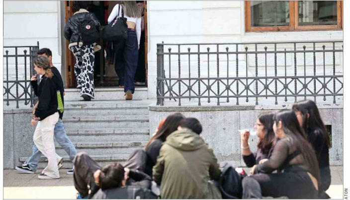
ESCENARIO. — El proyecto del FES frena la ampliación de la política de la gratuidad y traspasa de manera obligada al nuevo sistema a los deudores morosos del CAE cuyas garantías de sus créditos fueron ejecutadas.

del Ejecutivo causará un detrimento económico para las instituciones: “Lo va a provocar en la medida que no haya maneras más sustantivas de apoyar el fi-