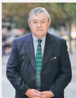
Por: Claudio Reyes, subsecretario de Previsión Social.

El entorno de trabajo seguro y saludable es un derecho fundamental para todas las personas trabajadoras. Es por ello que, con la entrada en vigor del nuevo Reglamento de Gestión Preventiva de Riesgos Laborales, a partir del 1° de febrero de 2025, Chile da un paso decisivo hacia la creación de una cultura preventiva en todas las organizaciones. Este avance se materializa a través del Decreto Supremo N° 44, con un esfuerzo conjunto y coordinado entre diversas instituciones públicas y privadas, con el objetivo de fortalecer la seguridad y salud en los lugares de trabajo.