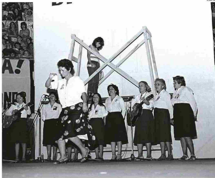
TODAS LAS FOTOGRAFÍAS SON EN BLANCO Y NEGRO Y DE DIFERENTES TAMAÑOS.