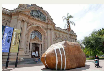
Una roca en el lugar de la escultura "Unidos en la gloria y la muerte", de Rebeca Matte, frente al Bellas Artes. Era "Palabras mayores", 2023, de Enrique Matthey.

El cambio es inherente a la vida, el arte es reflejo de sus propios límites. Con la aparición de la fotografía (1839) las artes visuales se liberaron de su función mimética, abriéndose el camino para la experimentación e innovación, y el público lo resintió. El fin de la "fiación renacentista con el ilusionismo" (Clement Greenberg) hizo, efectivamente, que las vanguardias no tuvieran audiencias masivas. A partir del siglo XX los artistas dejaron de ceñirse a una sola disciplina, adoptaron estrategias de otras áreas y luego en la posmodernidad introdujeron imágenes de la cultura de consumo y se apropiaron de las creaciones de otros(as) para modificarlas; continuaron, por cierto, incorporando a sus trabajos nuevas tecnologías, recientemente IA. En un mundo multicultural y globalizado, cabe preguntarse si es factible hablar de un gusto universalizado que satisfaga a la mayoría. La respuesta obvia es no. Sin embargo, por esa misma globalización y porque la sociedad está cada vez más mediada por tecnologías digitales —donde la adic-