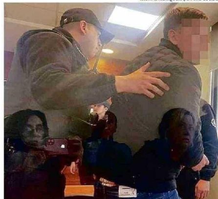
ESTE AÑO ACUSADOS DE ASESINATO DE EXPDI QUEDARON PRESOS.

En conversación con Diario El Líder el prefecto que tiene 31 años de trayectoria respondió ante la situa-