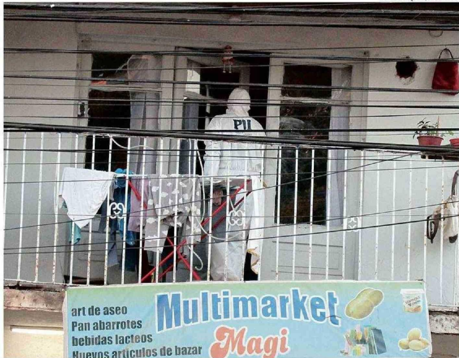
PREFECTO DESTACÓ EL TRABAJO EN TIEMPO RÉCORD PARA CAPTURAR A PAREJA DE VENEZOLANOS IMPLICADOS EN HOMICIDIO DE ADULTA MAYOR.

Arguedas Blanco enfatizó que en esa indagatoria trabajaron mancomunadamente la Brigada de Homicidios con la Brigada Investigadora de Robos (Biro) y de Investigación