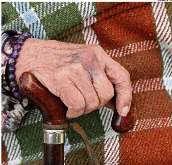
UN FACTOR CRÍTICO ES LA SALUD DENTAL Y VISUAL DE ADULTOS MAYORES: MUCHOS NO PUEDEN LEER ETIQUETAS.

mentaria se refiere a "la disponibilidad limitada o incierta de alimentos por factores sociodemográficos, ingreso económico, conocimientos y habilidades nutricionales, cercanía con lugares de abastecimiento, red de apoyo y otros".