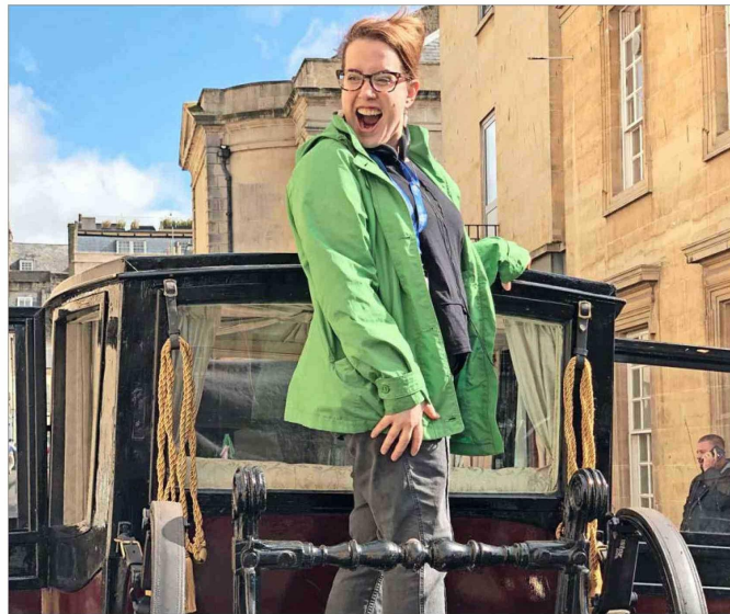
Desde niña Julia Quinn fue una voraz lectora de literatura romántica. En la imagen se la ve sobre un carruaje de época, en el set de grabación de la serie “Bridgerton”, inspirada en sus novelas del mismo nombre.

Quinn escribió la saga de “Los Bridgerton” entre 2000 y 2006