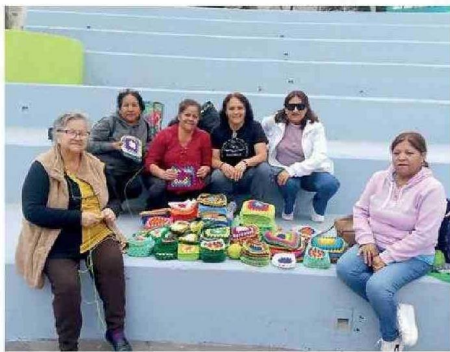
MUJERES TOCOPILLANAS EN INTERVENCIÓN EN LA PLAZA CONDELL

El objetivo de esta organización es visibilizar el borde costero, el esfuerzo de sus mujeres y proyectar la artesanía local como una expresión que ponga en relevancia el arte femenino construido en las ca-