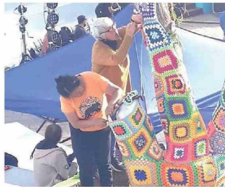
SE ADORNARON LOS ÁRBOLES DE LA PLAZA CARLOS CONDELL