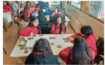
ALUMNOS DEL COLEGIO ALTAMIRA DE COYHAIQUE LO PROBARON.