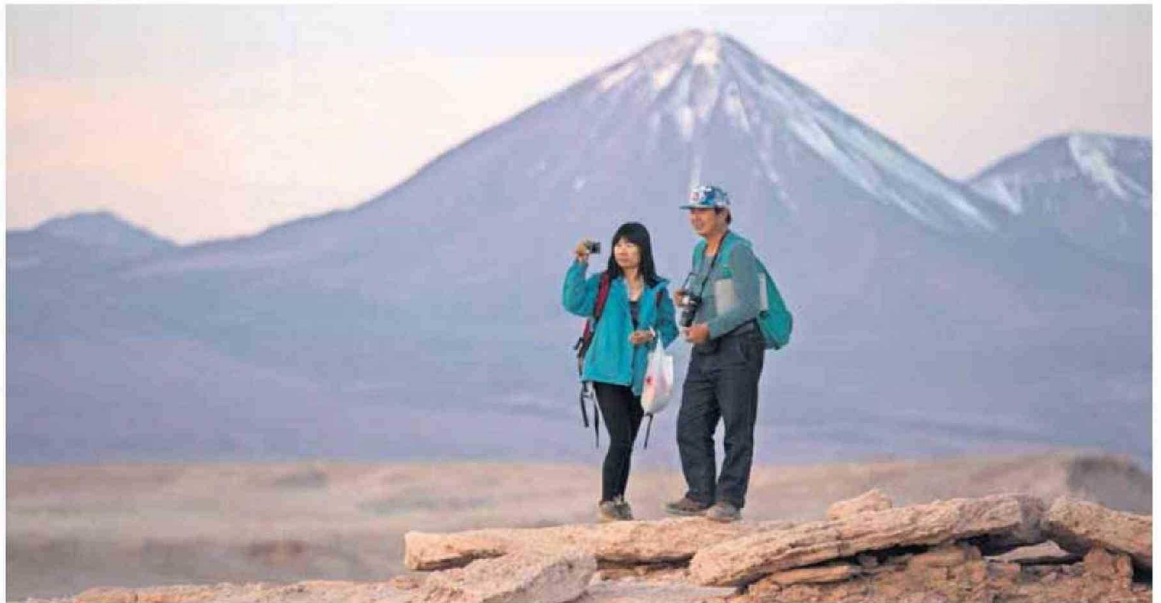
UNA POSTAL TÍPICA EN LA COMUNA DE SAN PEDRO DE ATACAMA: VOLCANES, LAGUNAS, SALARES Y CORDILLERAS ÚNICAS POR SU BELLEZA.

En definitiva, la comuna es un zona para redescubrir en cada visita.