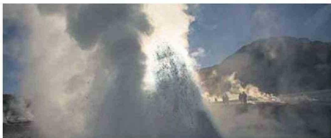
LOS GÉISERES DEL TATIO (DEL KUNZA TATA-IU, QUE SIGNIFICA 'EL ABUELO QUE LLORA').