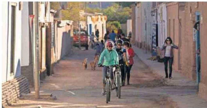
EL POBLADO DONDE LLEGAN TURISTAS DE TODAS LAS PARTES DEL MUNDO.