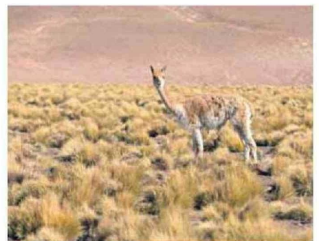
UN GUANACO QUE VIGILA EL PASO POR SUS TERRITORIOS.