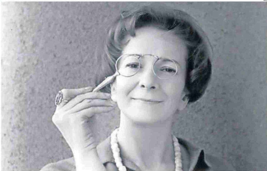
LA AUTORA RECIBIÓ EL PREMIO NOBEL DE LITERATURA EN 1996.

A remitentes con nombre y apellido aparecen respuestas como "lo que vamos a decir a continuación suena muy desmoralizador: es usted una persona demasiado franca y cándida para escribir bien. En las entrañas de un escritor con talento se arremolinan los más diversos demonios. E incluso si antes o después de escribir se encuentran adormecidos (o deberían encontrarse adormecidos), durante la escritura tienen una frenética actividad. Sin su ayuda, el escritor no podría adentrarse en las complicadas vivencias de sus personajes. Nada humano me es ajeno: ¡oh, esta sentencia no se puede aplicar a las vidas de los santos bondadosos!