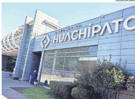
INDICARON QUE FUE UN FINAL DIGNO Y EMBLEMÁTICO.

"Incluso en este proceso doloroso de suspensión fueron ejemplo de resiliencia, operando de manera impecable hasta fabricar la última tonelada de acero planificada", agregó.