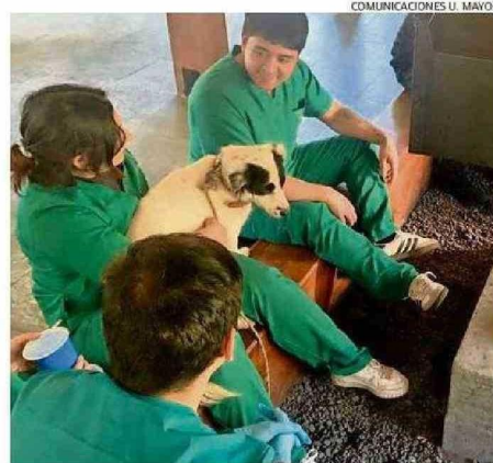
EN TOTAL, DURANTE EL DÍA DEL OPERATIVO SE REALIZARON SEIS CIRUGÍAS DE ESTERILIZACIÓN Y 30 ATENCIONES CLÍNICAS.