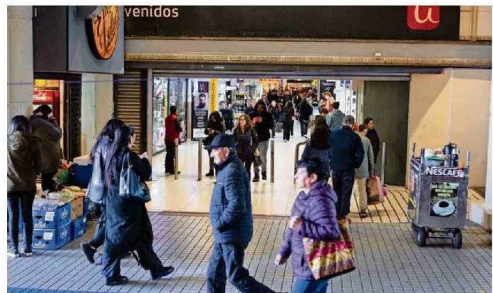
LA LLEGADA DE TURISTAS GENERA UN IMPACTO EN LA ECONOMÍA LOCAL, APUNTAN DESDE DIVERSOS SECTORES.

El coordinador de Turismo también atribuyó este fenómeno a diversos factores económicos y sociales, exponiendo que "creemos que el tipo de cambio, las liberaciones y estímulos de la actividad económica en Argentina y el desarrollo de nuestra industria local como un polo de desarrollo, explican este flujo significativo y el aumento que es percibido en nuestra ciudad durante los úl-