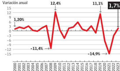
Fuente Clapes UC en base a Superintendencia de Pensiones y Banco Central EL MERCURIO