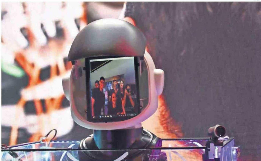
LA CABEZA DE STELARBOT YA ESTÁ LISTA Y SE EXHIBIÓ EN CONGRESO FUTURO 2025. EN EL CASCO SE VERÁ EL ROSTRO DEL USUARIO.