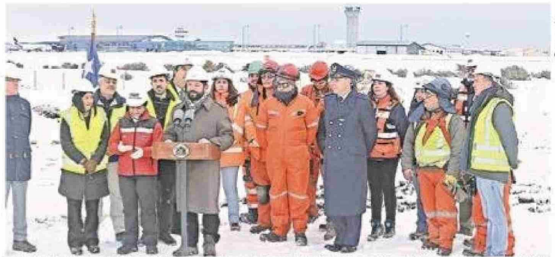
El Presidente Gabriel Boric realizó el anuncio en el Aeropuerto Presidente Ibáñez, en compañía de la ministra de Obras Públicas, Jessica López, autoridades regionales, comunales y trabajadores.

Tal vez lo dijo porque mucho se ha hablado sobre la inversión relevante que Argentina realiza en ciudades de la Patagonia, como Río Gallegos, Río Grande y para qué