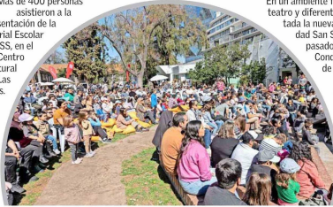
Más de 400 personas asistieron a la presentación de la Editorial Escolar USS, en el Centro Cultural Las Condes.

En un ambiente familiar, acompañado de música, teatro y diferentes talleres al aire libre, fue presentada la nueva Editorial Escolar de la Universidad San Sebastián (USS), el 31 de agosto pasado, en el Centro Cultural de Las Condes, para potenciar la experiencia de la lectura y el aprendizaje. Se trata de una editorial complementaria al currículum educacional, que ya cuenta con su primera colección de libros que integran recursos digitales interactivos, como "Navegantes, protagonistas inesperados de una aventura que cambió el mundo", "Todos para uno y uno para todos. Guía para pequeños y grandes ciudadanos", "Fátima", y "Fundamentales".