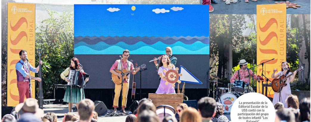
La presentación de la Editorial Escolar de la USS contó con la participación del grupo de teatro infantil "Los Patapela".