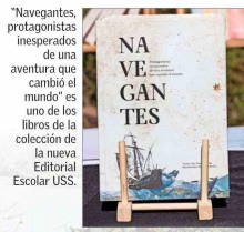
"Navegantes, protagonistas inesperados de una aventura que cambió el mundo" es uno de los libros de la colección de la nueva Editorial Escolar USS.