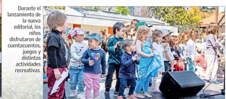
Durante el lanzamiento de la nueva editorial, los niños disfrutaron de cuentacuentos, juegos y distintas actividades recreativas.