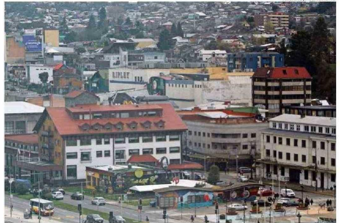
EXISTE COINCIDENCIA EN QUE TRAS ESTE RESULTADO, LA REGIÓN TIENE OPORTUNIDADES DE SEGUIR CRECIENDO.