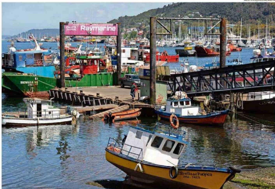
LA ACTIVIDAD DE LA INDUSTRIA ACUÍCOLA Y PESQUERA FUE RELEVANTE PARA ALCANZAR ESTE NIVEL DE DESARROLLO ECONÓMICO EN LOS LAGOS.