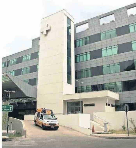
H. REGIONAL ES REFERENTE NACIONAL EN CIRUGÍAS AL CORAZÓN.

-La cirugía coronaria y la cirugía valvular. La cirugía coronaria consiste en palabras sencillas en