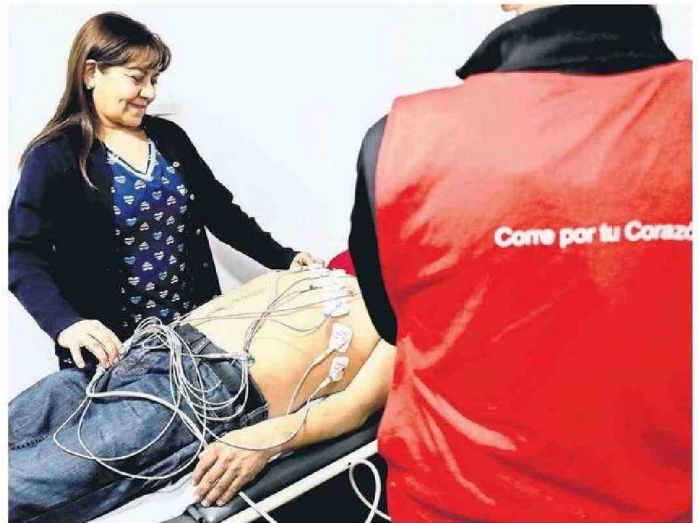
DISTINTAS ACTIVIDADES PREVENTIVAS SE REALIZAN EN EL MARCO DE AGOSTO, EL MES DEL CORAZÓN.