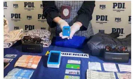
LA PDI RECUPERÓ DINERO, ESPECIES Y MÁQUINAS TRANSBANK.