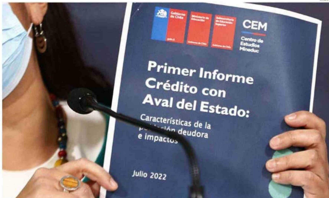
TERMINAR CON EL CAE ES UNA PROMESA DE CAMPAÑA DEL PRESIDENTE BORIC. LA NOCHE DE ESTE LUNES 7 DE OCTUBRE SE DIO A CONOCER LOS PRIMEROS DETALLES DEL PROYECTO.

La iniciativa de gobierno contempla en primer lugar "perdonar" parcialmente la