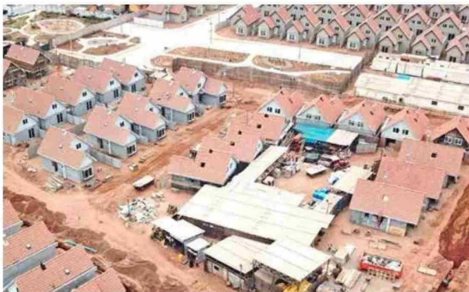
Este aumento del valor en la construcción, asociado al tema de la protección por la delincuencia, termina siendo traspasado directamente a los compradores.