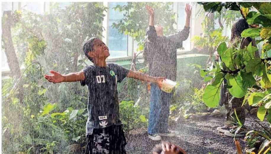
EL JARDÍN BOTÁNICO DE AGUAS ANTOFAGASTA CUENTA CON 10 ÁREAS TEMÁTICAS, QUE OCUPAN 3.200 M2 DE ÁREAS VERDES.

Grandes y chicos disfrutarán allí de una espectacular naturaleza, junto a más de 560 especies nativas en el árido norte del país. Quienes participen de la cita para recorrer las instalaciones "encontrarán inspiración de sobra en esta actividad organizada por el evento literario que cumple 15 versiones este año y