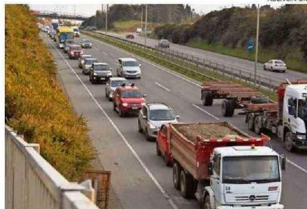
CAMIONES, BUSES Y AUTOS ESPERAN POR INGRESAR A LA CIUDAD.

Advirtió que lo que ocurre en el acceso sur "es sumamente peligroso y requiere una solución rápida. Porque no es sólo un taco kilométrico que se forma en la entrada a Puerto Montt, sino que muchas perso-