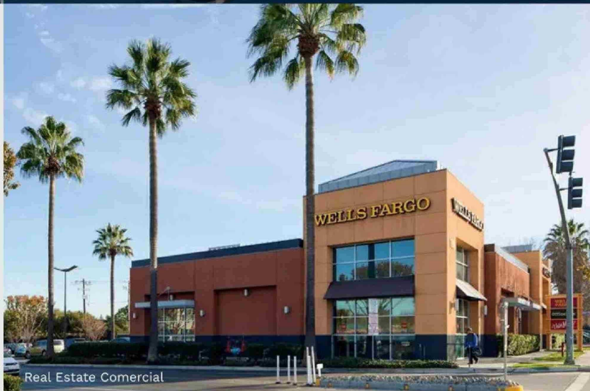
Real Estate Comercial