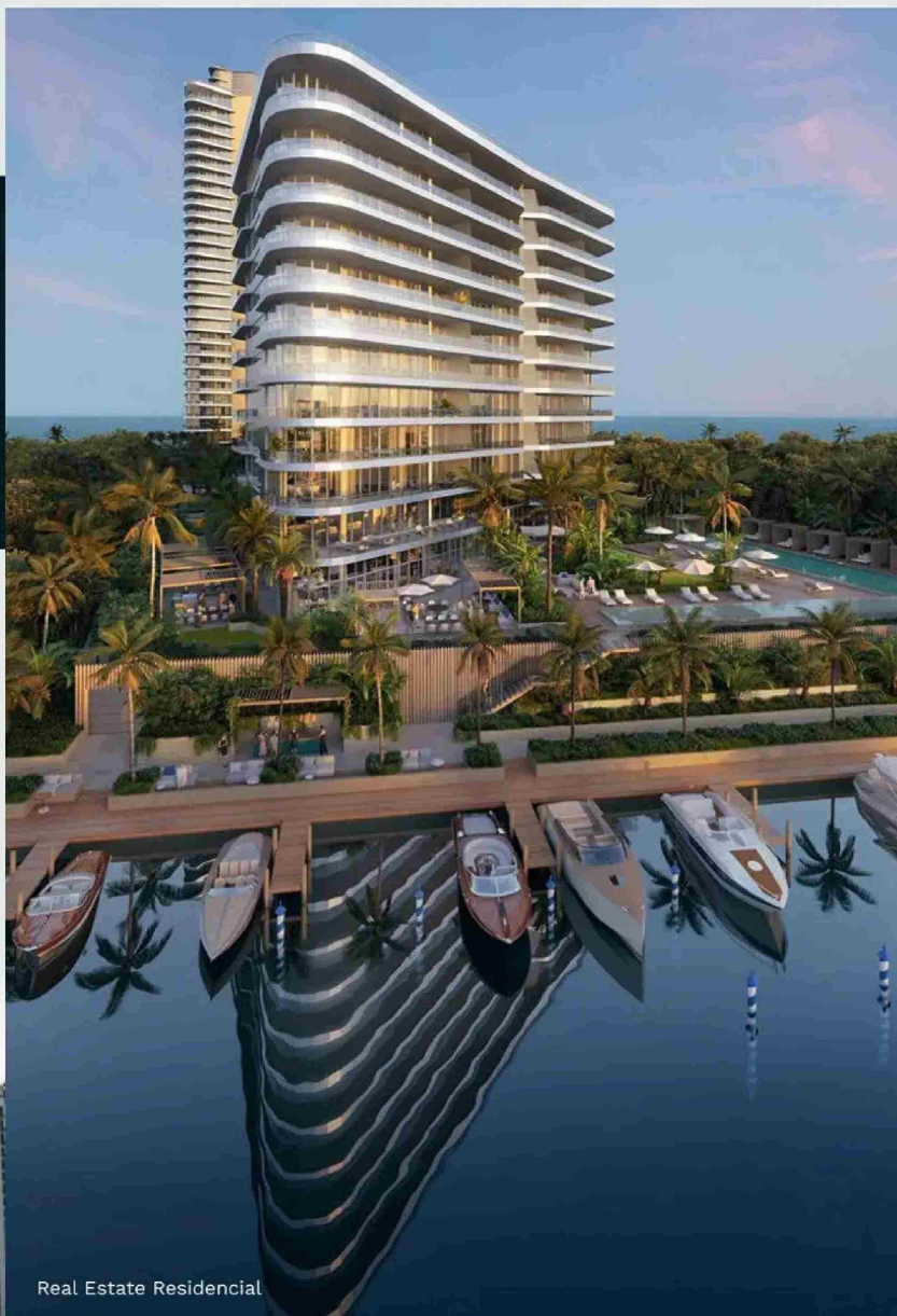
Real Estate Residencial