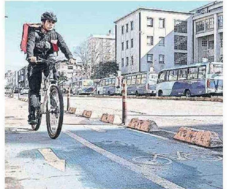
LOS CICLISTAS ESPERAN EN UN FUTURO TENER MÁS CONEXIONES

A pesar de que el Gran Concepción es noveno a nivel nacional en tener mayor extensión de infraestructura ciclista, siguen existiendo zonas sin conexión.