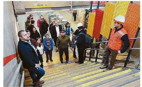
EN COLOR NARANJA LA CELOSÍA QUE IMPIDE EL PASO IRREGULAR.

Saavedra también sostiene que están coordinados con Carabineros, “con fiscalizaciones que han permitido, como tienen las facultades, de cursar multas a los evasores”. En