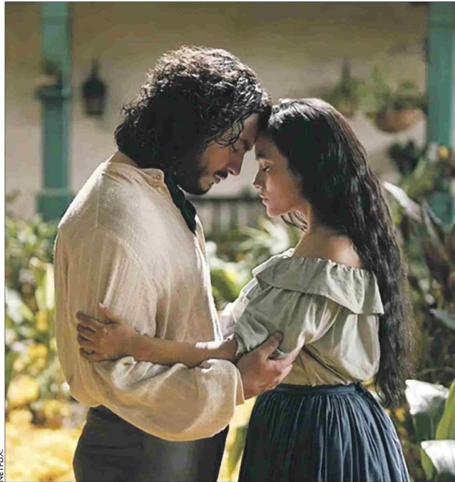
La adaptación de "Cien años de soledad" se encuentra en Netflix.

"El Chacal" ha entrado en las listas de las mejores series del año. Relata la his-