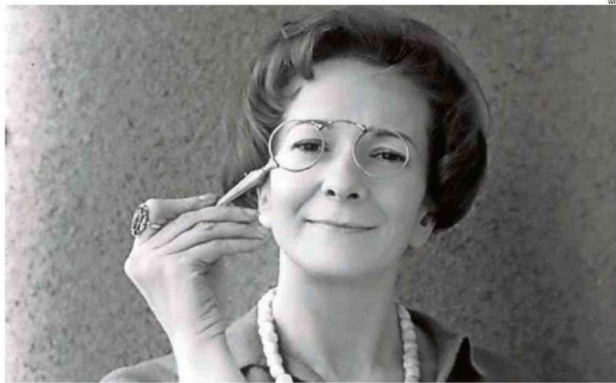
LA AUTORA RECIBIÓ EL PREMIO NOBEL DE LITERATURA EN 1996.

A remitentes con nombre y apellido aparecen respuestas como "lo que vamos a decir a continuación suena muy demoralizador: es usted una persona demasiado franca y cándida para escribir bien. En las entrañas de un escritor con talento se arremolinan los más diversos demonios. E incluso si antes o después de escribir se encuentran adormecidos (o deberían encontrarse adormecidos), durante la escritura tienen una frenética actividad. Sin su ayuda, el escritor no podría adentrarse en las complicadas vivencias de sus personajes. Nada humano me es ajeno: ¡oh, esta sentencia no se puede aplicar a las vidas de los santos bondadosos! Reciba