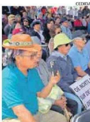
SOLCOR SERÁ LA ANFITRIONA.

EL FINANCIERO DE CALAMA | JUEVES 25 DE ENERO DE 2025