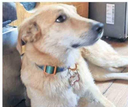
"MOLLY" ES UNA PERRITA DE DOS AÑOS Y NUEVE MESES.

Comentó, además, que han recibido videos e imágenes de "Molly" y cada vez que llegan al lugar, la mascota ya no se encuentra en el sector.