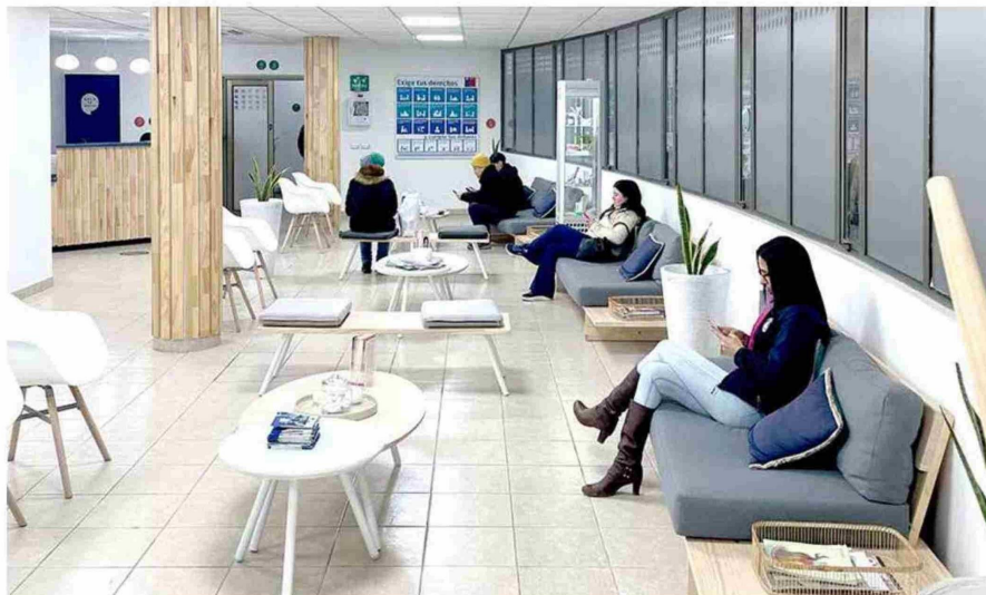
La Clínica Somos Dent cuenta con moderna infraestructura.