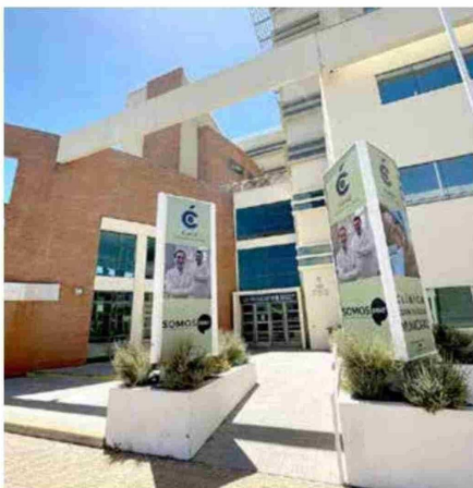
La Clínica Odontológica Municipal, está instalada en el antiguo edificio de La Araucana.

“Por esa razón, ofrecemos precios más económicos que en el mercado, un 30 por ciento más baratos. Y de esa manera, la comunidad pueda acceder oportunamente a tratamientos dentales”, precisó Muñoz. Junto con esto, el director