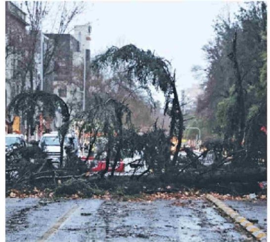
► La Alameda vio interrumpido su tránsito.