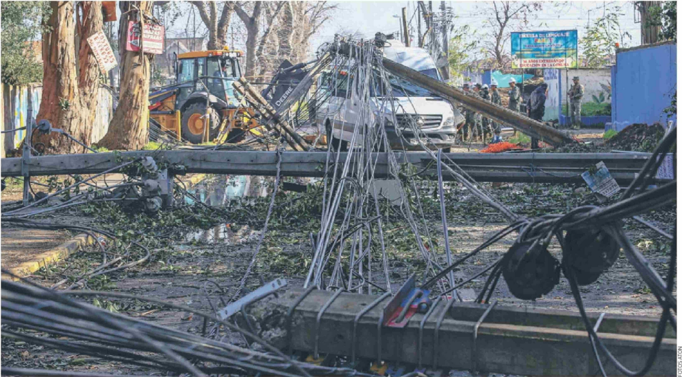
► Hasta este viernes, cinco comunas contaron con despliegue militar para colaborar en el despeje de calles. En la foto, Maipú.

caer son los pimientos, arces, melias, eucaliptos, acacio falso y grevillea. "Algunos individuos añosos, pero también ejemplares juveniles, debido a los fenómenos climáticos que han generado el debilitamiento de su condición fitosanitaria", asegura el director regional Illasca.