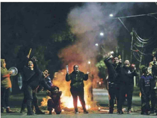
► Protestas en Pudahuel por falta de luz.

Morales concluye: "Lo peor que podríamos hacer es dejar de plantar. Las ciudades del futuro van a ser clasificadas no solo porque tengan agua, luz o un sistema de Metro, sino por la cantidad de sombra que tengan. Necesitamos 10 veces más árboles que los que tenemos, pero tenemos que plantar bien". ●