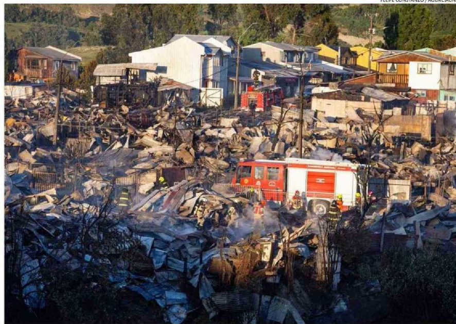
EL SINIESTRO DEJÓ UN ESCENARIO DE TOTAL DESTRUCCIÓN EN EL SECTOR ALTO DE CASTRO, DONDE SE DESPLEGARON 35 CARROS BOMBA.